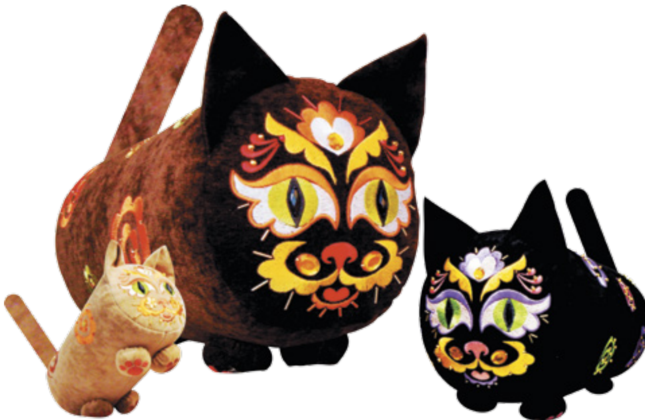
ДЕКОРАТИВНАЯ ПОДУШКА-ВАЛИК «КОТ» (БАРХАТ, НАЦИОНАЛЬНЫЙ ОРНАМЕНТ, РУЧНОЕ ДЕКОРИРОВАНИЕ)

Подушка-валик «Кот» – изделие декоративно-утилитарного назначения, призванное украсить собой любой интерьер и создать позитивное настроение.