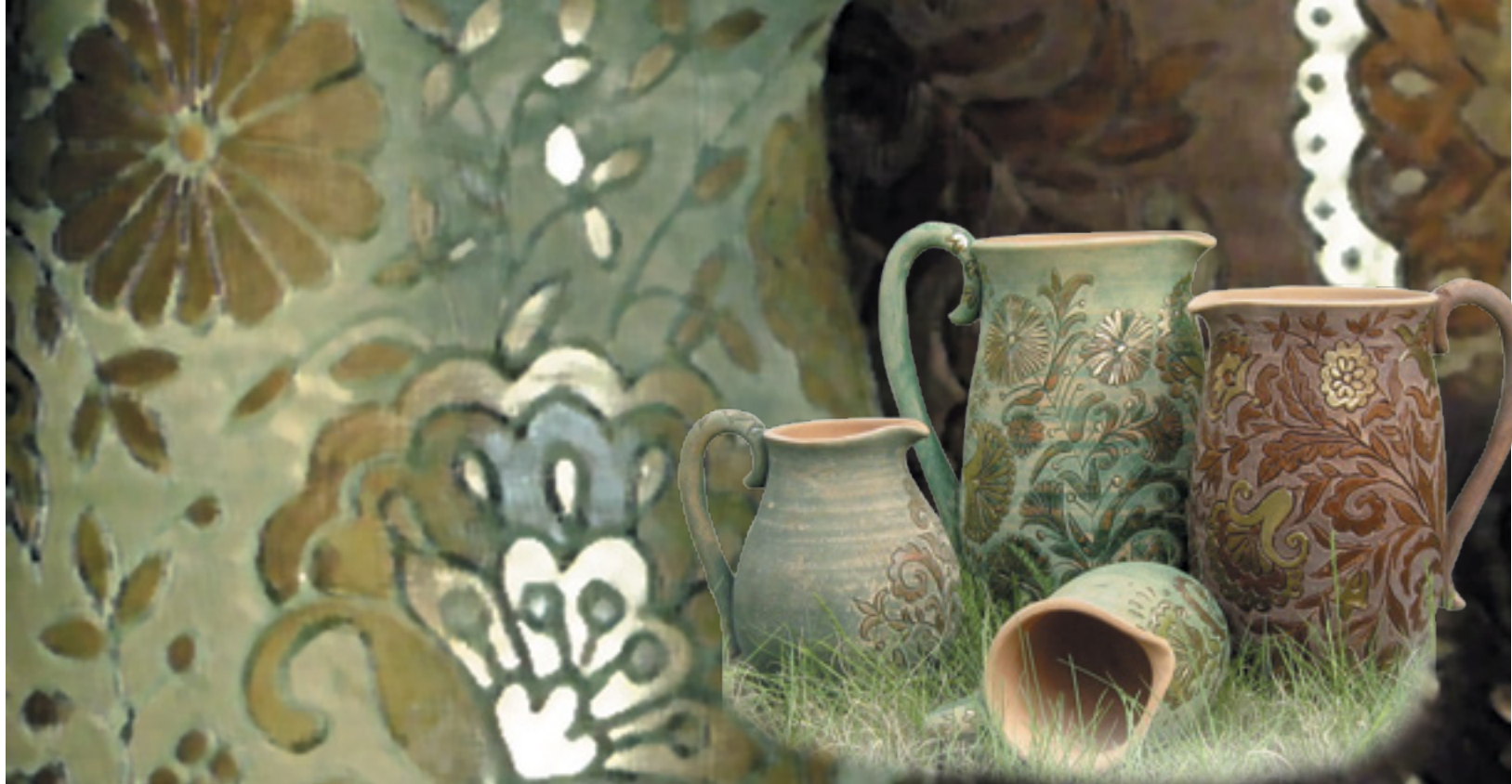
ВАЗА КЕРАМИЧЕСКАЯ «СЕРДЭШ»