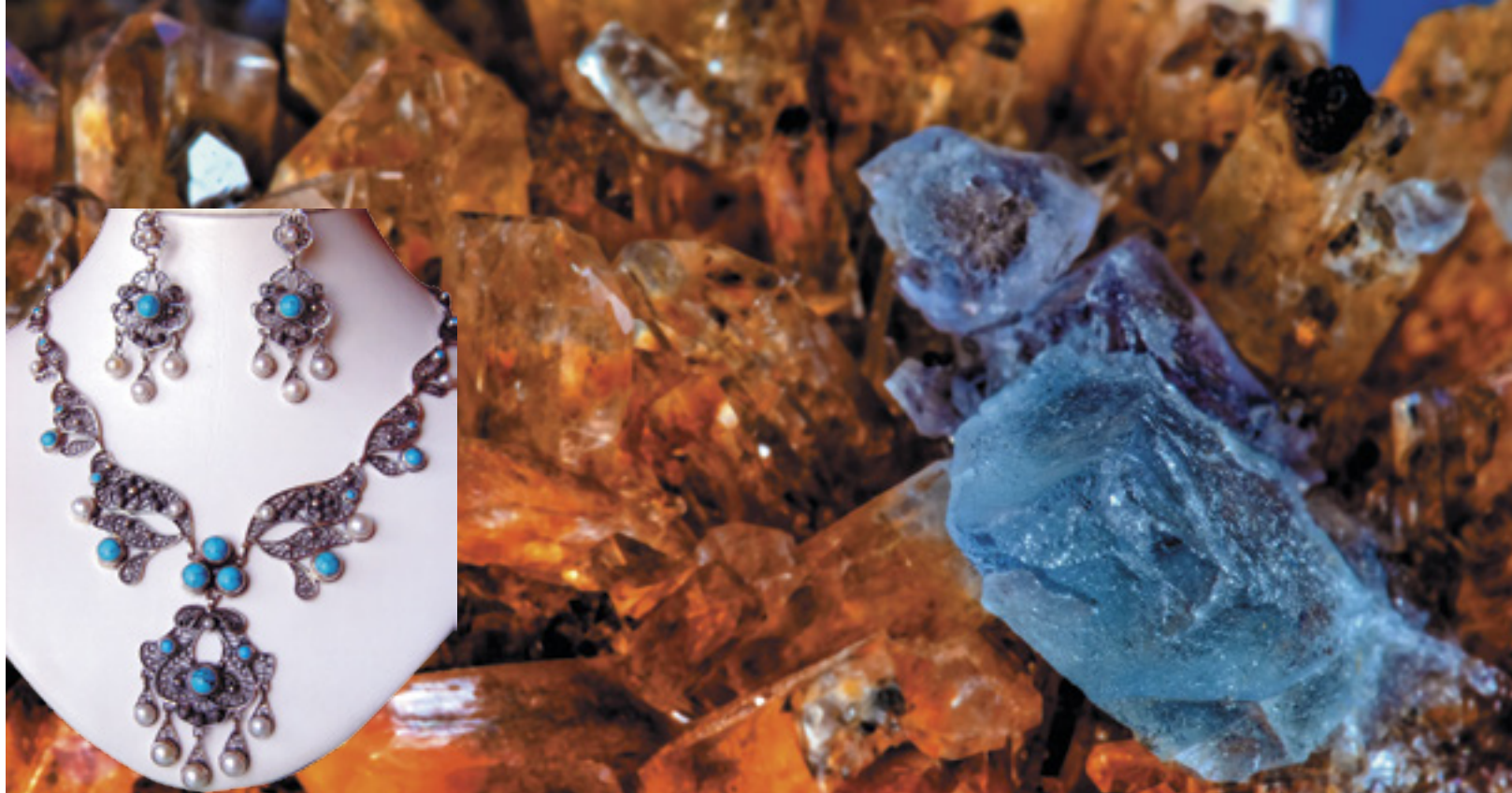
ЮВЕЛИРНЫЙ ГАРНИТУР: КОЛЬЕ, СЕРЬГИ (СЕРЕБРО, БИРЮЗА, ЖЕМЧУГ)

Авторские работы мастера находятся в музеях Татарстана, а также в частных коллекциях России и за рубежом. Изготавливает украшения, предметы интерьера и различные поделки в традициях и технике старых мастеров. Изделия мастера удостоены дипломами крупнейших международных выставок. Ювелирный гарнитур изготовлен из серебра с использованием бирюзы, жемчуга в технике ажурной и бугорчатой скани, зерни.