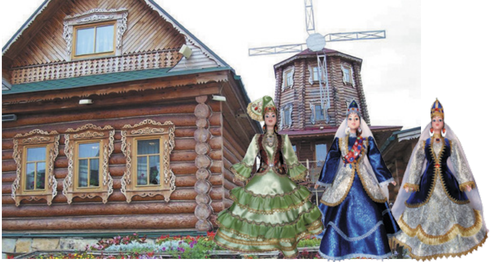
КУКЛЫ (НАЦИОНАЛЬНАЯ ТАТАРСКАЯ ОДЕЖДА В АССОРТИМЕНТЕ)

Оригинальные куклы в национальных костюмах, выполненные вручную искусной мастерицей, не оставят равнодушным самый взыскательный вкус. Работы мастера неоднократно участвовали в различных конкурсах, а также в специализированных российских и международных выставках.