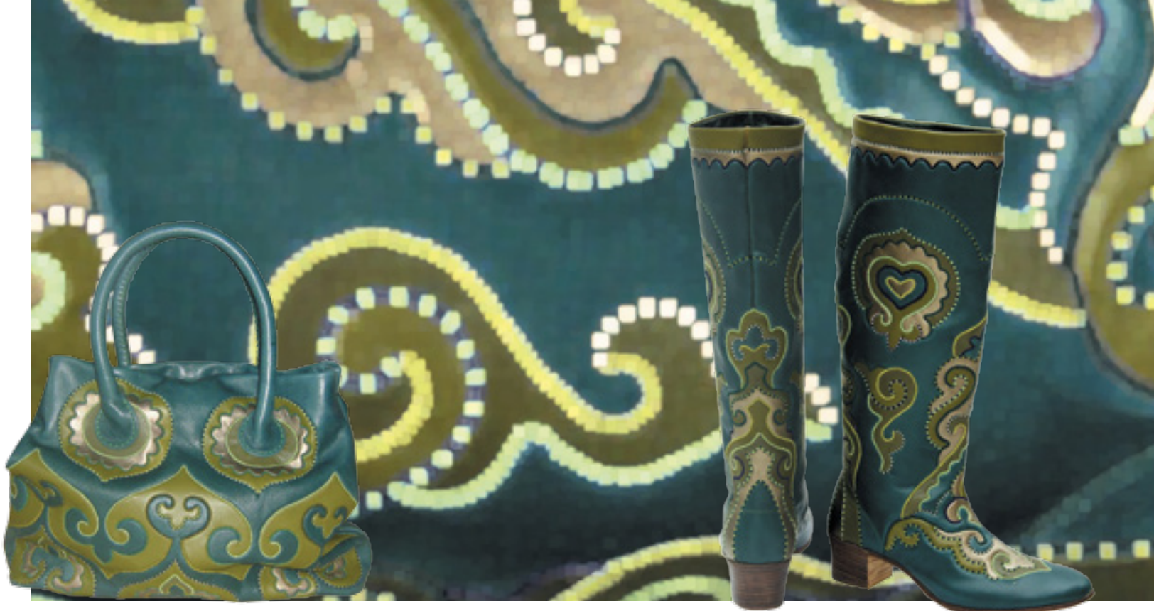
КОМПЛЕКТ (САПОГИ, СУМКА) В ТЕХНИКЕ «КОЖАНАЯ МОЗАИКА»

Возрождая лучшие традиции кожаной мозаики и технологии, ООО «Сахтиан» производит разнообразную обувь, декоративные панно, подушки, сумки, кисеты. Высокохудожественные изделия, выпускаемые предприятием, известны не только в Татарстане и России, но и за рубежом. Комплект выполнен из качественной кожи в традиционной технике «кожаная мозаика». Использование прочной кожи и особого шва обеспечивает изделию «вечную» жизнь.