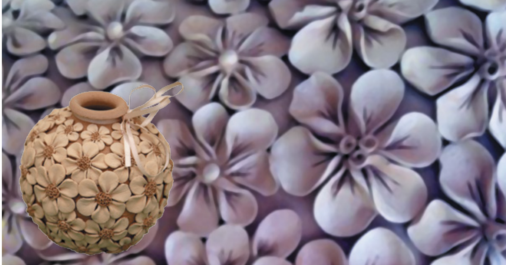
КЕРАМИЧЕСКАЯ ВАЗА «ЯБЛОНЕВЫЙ ЦВЕТ»